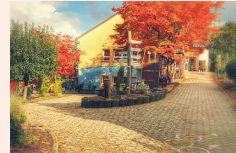
Kath. Kindergarten Liebfrauen

Kath. Kindergarten Liebfrauen | Kath. Kindergarten St. Pius