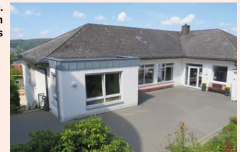
Kath. Kindergarten St. Pius